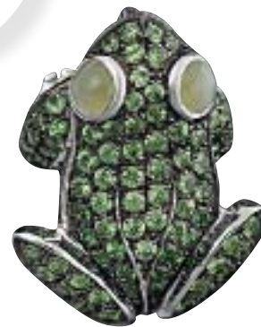
Брошь Frog, Sofragem. Рубрика «Драгоценности». С. 154

виенко, ретроспектива стиля лирических героинь клипов группы «Ленинград» от Анжели из «Сумки» до девушки в лабутенах из «Экспоната» и спецрубрика «Давайте одеваться как петербуржцы»