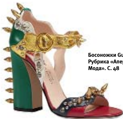
Босоножки Gucci. Рубрика «Аперитив. Мода». С. 48